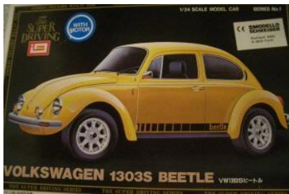
VW 1303S Beetle Imai Año de construcción: 1.972