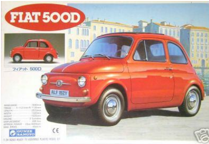
Fiat 500 D Gunze Sangyo / Mr.Hobby Año de construcción: 1.967