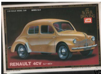
Renault 4 CV Imai Año de construcción: 1.947