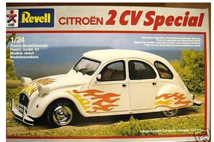
Citroën 2CV Special Revell Año de construcción: 1.977