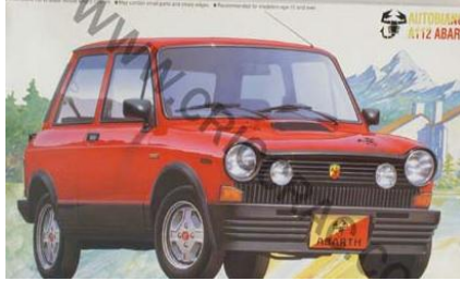
Autobianchi A-112 Abarth Fujimi Año de construcción: 1.971