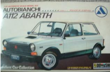
Autobianchi A-112 Abarth Doyusha Año de construcción: 1.971