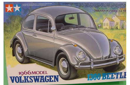
VW 13000 Beetle Tamiya Año de construcción: 1.966