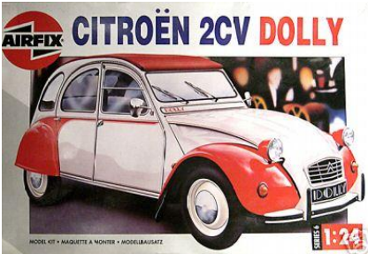
Citroën 2CV Dolly Airfix Año de construcción: 1.975