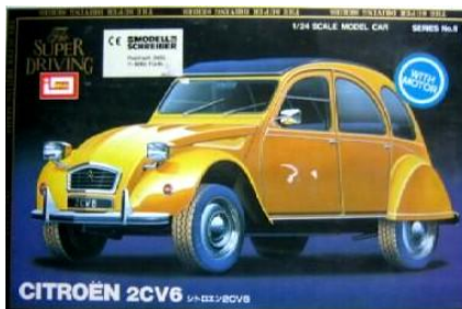
Citroën 2CV6 Imai Año de construcción: 1.963