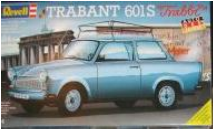
Trabant 601 S Revell Año de construcción: 1.957