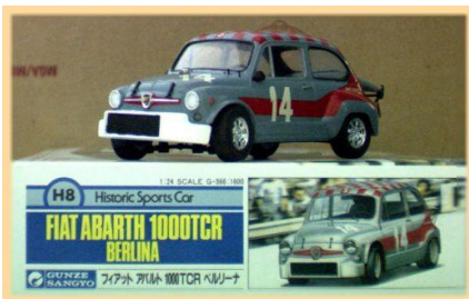
Fiat 1000 TCR Abarth Gunze Sangyo Año de construcción: 1.967