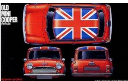
Morris Mini Cooper Fujimi Año de construcción: 1.975