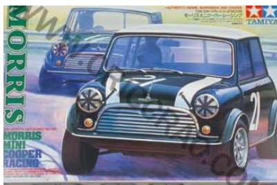
Morris Mini Cooper Tamiya Año de construcción: 1.964