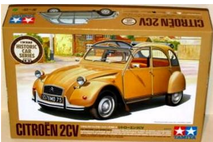
Citroën 2CV Tamiya Año de construcción: 1.963