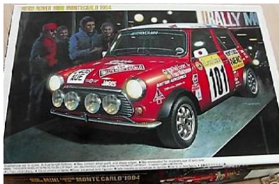
Rover Mini Cooper Fujimi Año de construcción: 1.975