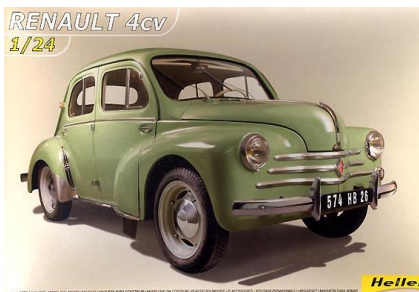
Renault 4 CV Heller Año de construcción: 1.947