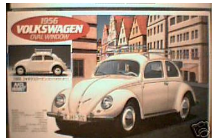
VW Beetle "Oval Window" Gunze Sangyo Año de construcción: 1.956