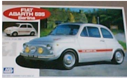
Fiat 595 Abarth Gunze Sangyo / Mr. Hobby Año de construcción: 1.967