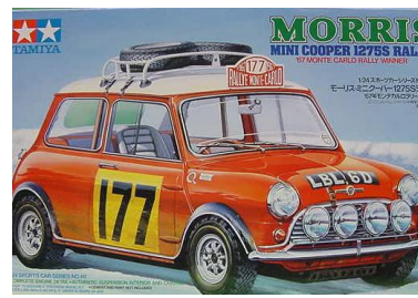
Morris Mini Cooper 1275 S Tamiya Año de construcción: 1.964