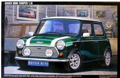
Rover Mini Cooper Fujimi Año de construcción: 1.975