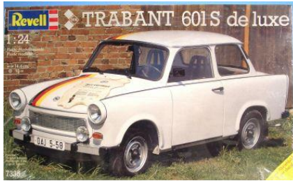
Trabant 601 S de luxe Revell Año de construcción: 1.957