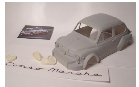
Fiat 1000 TCR Abarth Corso Marché (resina) Año de construcción: 1.967