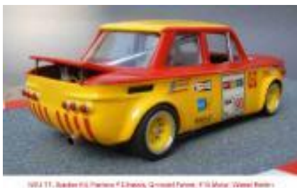
NSU TT Spicker (resina) Año de construcción: 1.965