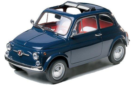
Fiat 500 F Tamiya Año de construcción: 1.967