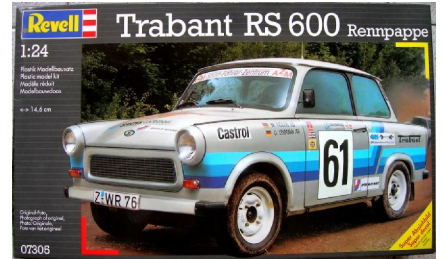
Trabant RS 600 Revell Año de construcción: 1.957