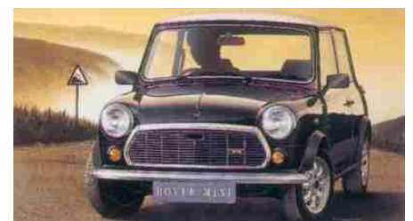
Rover Mini Clubman Fujimi Año de construcción: 1.975