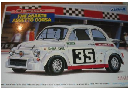
Fiat 500 Abarth Assetto Corsa Gunze Sangyo Año de construcción: