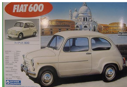
Fiat 600 Gunze Sangyo Año de construcción: 1.967