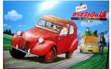
Citroën 2CV Clarise Gunze Sangyo Año de construcción: 1.959