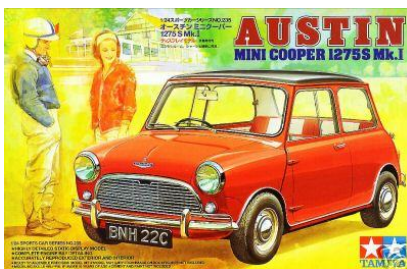
Austin Mini Cooper 1275 S Tamiya Año de construcción: 1.959