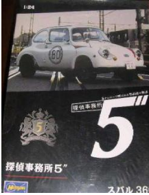
Subaru 360 DX Hasegawa Año de construcción: 1.958