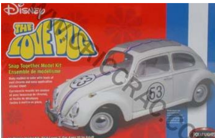
VW Beetle "Herbie" Polar Lights Año de construcción: 1.966