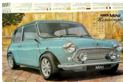
Morris Mini Kensington Fujimi Año de construcción: 1.963