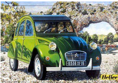
Citroën 2CV Heller Año de construcción: 1.963